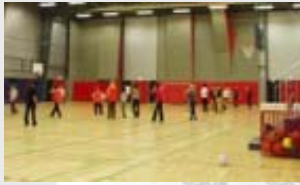
Sportshal, Svenborg Gymnasium