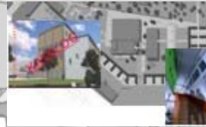
Idrætshus i Assens