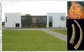
Museum Kongernes Jelling