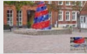
Renovering af Vandspiral